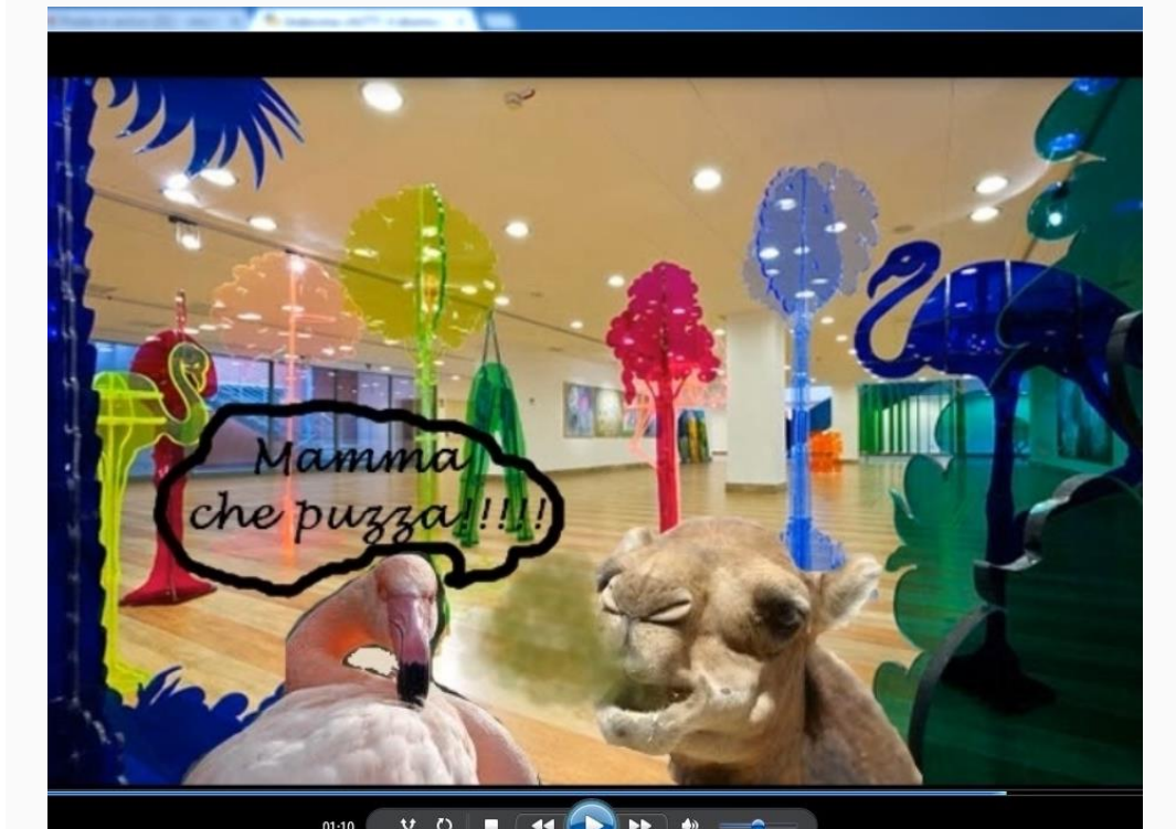
Figura 4. Il dromedario Luigi.

creativi (Figura 4) principalmente tramite la coloritura e l'aggiunta di nuovi particolari (testo e altri segni usando lo strumento pennarello, o lo strumento tampone) .