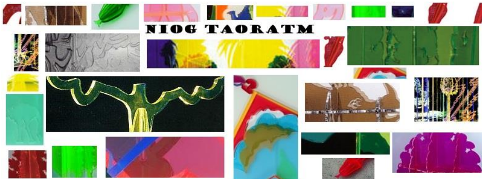
Figura 1. Anagramma e collage.

ricomporre correttamente l'anagramma e venire a conoscenza del nome del personaggio. Sempre utilizzando Hot Potatoes è stato infine somministrato un quiz a scelta multipla per verificare e confermare le informazioni fornite nel gioco Indovina chi?