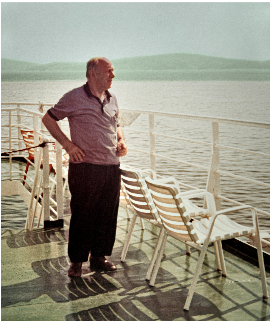
Sulla nave verso Atene