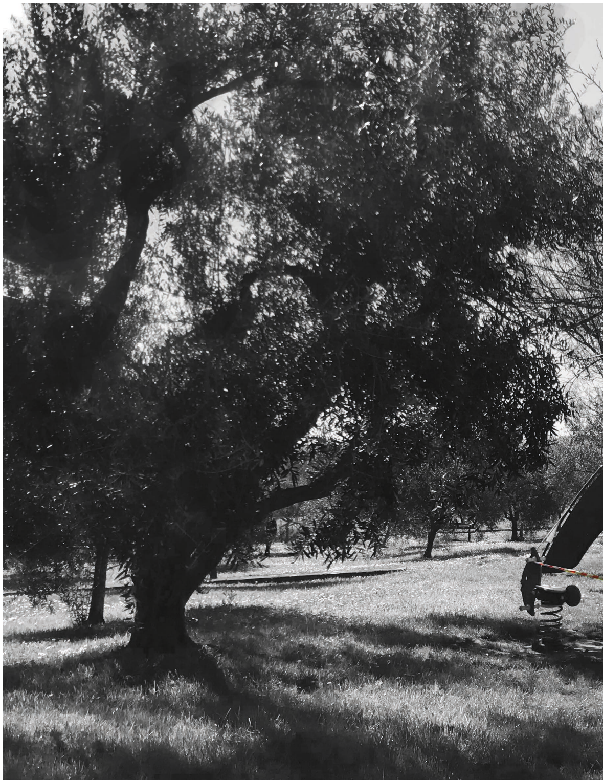
Fig. 4 – Sesto Fiorentino 30.03.2020. Divieto di accesso ai parchi e alle aree gioco pubbliche.