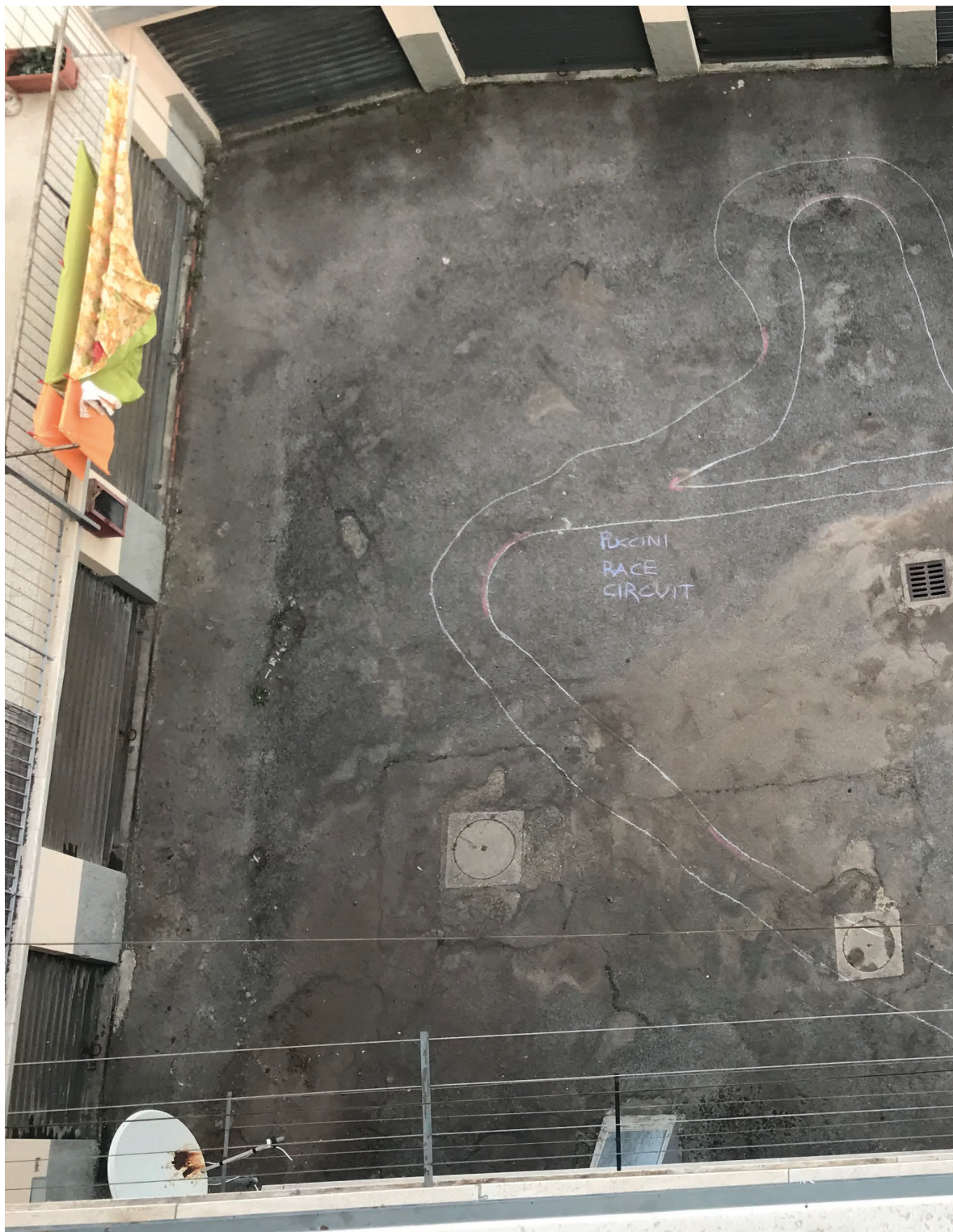
Fig. 1 – Sesto Fiorentino 17.03.2020.

Una resede condominiale per l'accesso ai garage si improvvisa spazio gioco per bambini durante il lockdown.