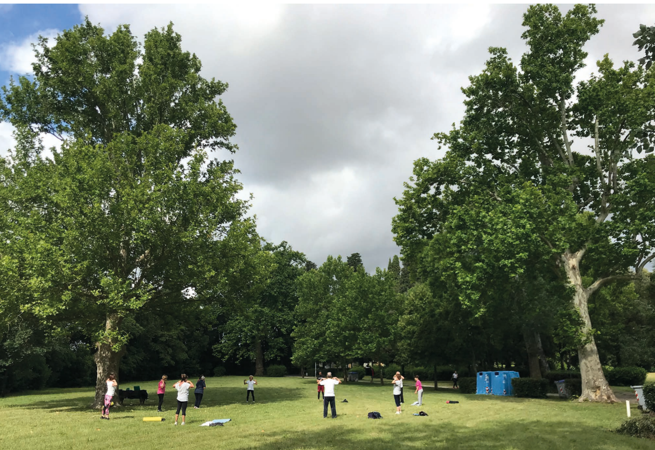
Figg. 5-6 – Sesto Fiorentino. 05.06.2020, 11.06.2020.

I parchi pubblici durante la pandemia hanno ben espresso il loro ruolo di spazio di condivisione e di aggregazione, diventando spazi per poter effettuare riunioni di lavoro o attività fisica in sostituzione alle palestre chiuse, rispettando comunque il distanziamento fisico.