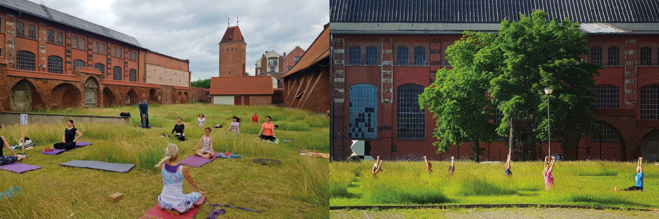
Fig. 7-12 – Galeria EL Art Centre in Elbląg (Poland): 18.06.2020 Social distancing lawn brings people together.