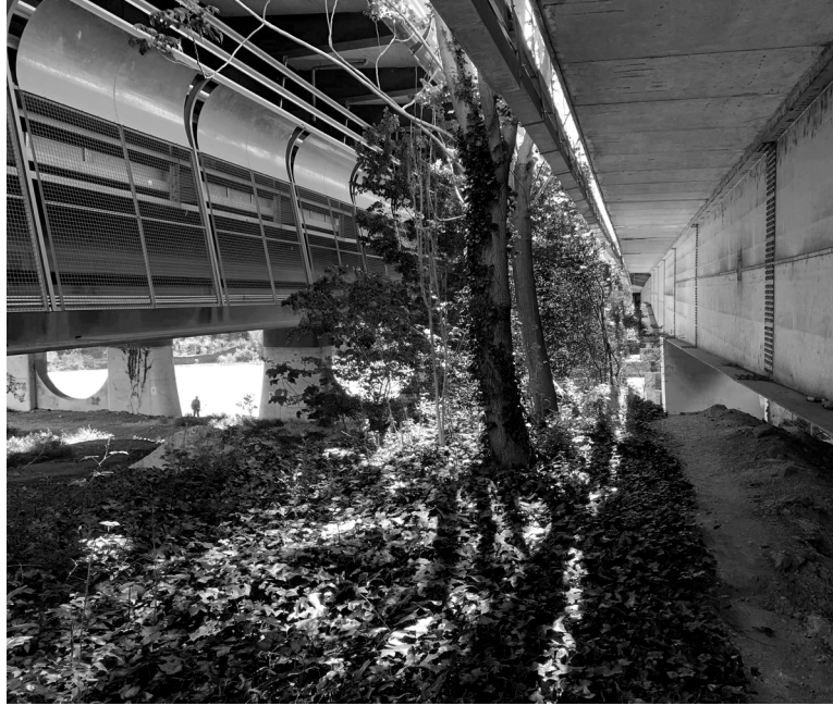
Fig. 8 - Fotografia della vegetazione spontanea cresciuta sui detriti al di sotto delle corsie del G.R.A., Saxa Rubra, Roma.

tematizzare la discontinuità entro un nuovo pensiero creativo.