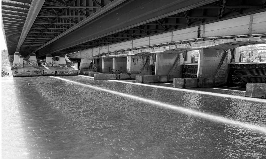
Fig. 3 - Fotografia della Centrale Idroelettrica di Castel Giubileo, Saxa Rubra, Roma.