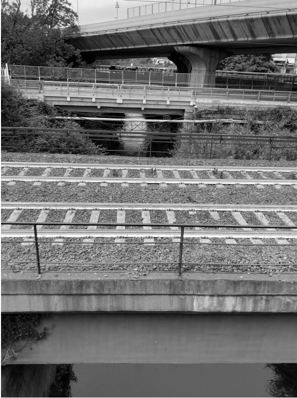
Fig. 5 - Fotografia dell'intreccio tra quattro differenti infrastrutture titaniche: l'affluente Cremera, il Viadotto Giubileo del 2000, il G.R.A. e la ferrovia Flaminio-Montebello, Saxa Rubra, Roma.