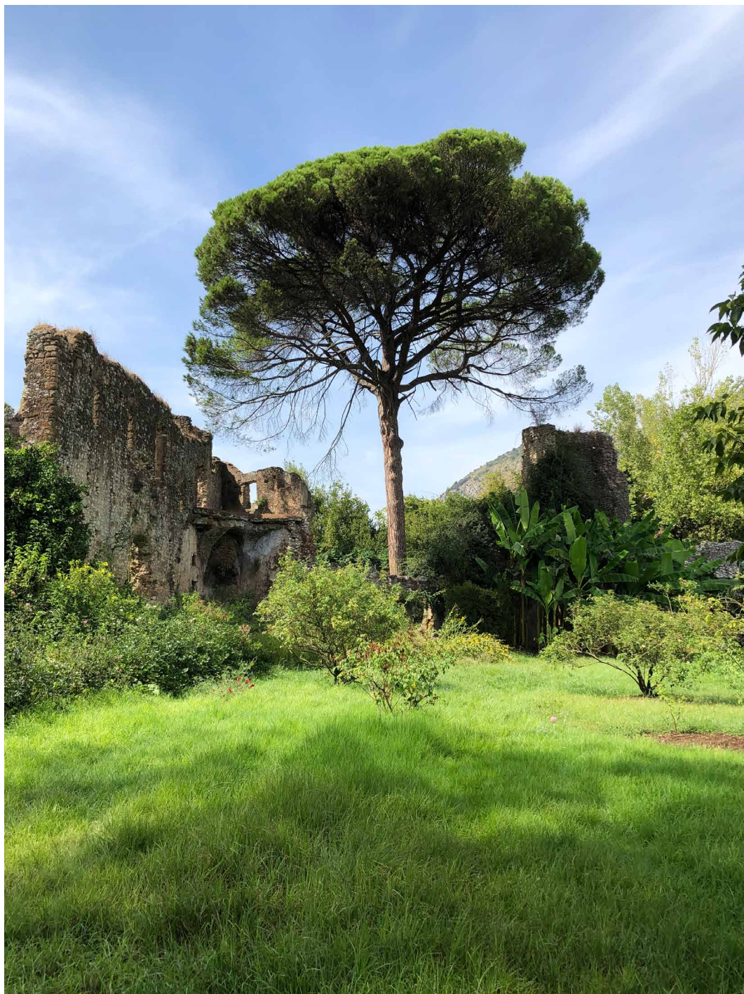
Fig. 5 - Giardino di Ninfa, Cisterna di Latina (LT), (foto: G. Strano 2024).