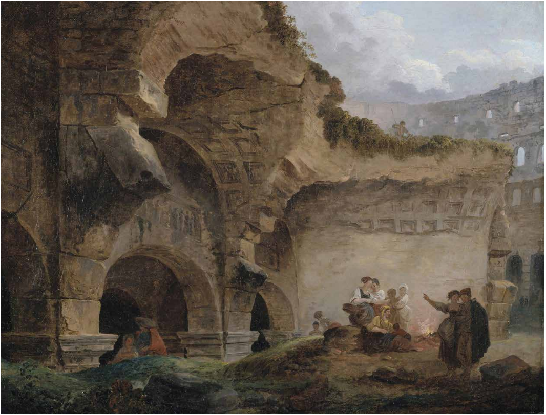
Fig. 4 - Lavandaie tra le rovine del Colosseo (Laveuses dans les ruines du Colisée), Hubert Robert, realizzato intorno al 1760 (foto: Brooklyn Museum di New York).

cepire un mondo presociale, una condizione originaria libera dalle sovrastrutture che, secondo Rousseau, hanno alienato l'uomo. Questo silenzio è accompagnato dal trionfo visibile della natura sull'artificio. La rovina, spogliata della sua funzione originaria, viene riassorbita in un ordine cosmico più vasto e autentico, non rappresentando una semplice distruzione, ma una forma di purificazione. Questo spettacolo della natura che prevale sull'opera dell'uomo incarna l'ideale di un'armonia primigenia, dove l'essere umano non era dominatore del suo ambiente ma parte integrante di esso. Hubert Robert, a differenza del sublime e drammatico Piranesi, interpreta tale sfumatura e rappresenta la rovina come un luogo sereno, quasi domestico. Nelle sue tele, le rovine maestose dell'antica Roma diventano lo scenario per scene di vita quo-