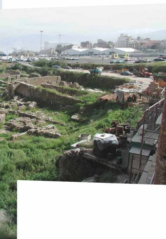
Fig. 7 - Il sito di Hadiqat As-Samah ripreso dalla cattedrale maronita di San Giorgio, Beirouth, Lebanon, 2006.

si configura come un'operazione di ripristino di un'origine idealizzata o perduta, bensì come un atto progettuale che accompagna e interpreta le metamorfosi del luogo, valorizzandone la molteplicità semantica sedimentata nel tempo (fig. 9). Come osserva Metta “nel rendere confusa e sfuggente la separazione tra umanità e mondo, tra città e selva, tra urbanità e natura che c'è tutta la ricchezza di opportunità e l'urgenza di domande per il progetto di paesaggio contemporaneo e futuro, dal quale ci si aspetta un nuovo passo, un deciso passo avanti” (Metta, 2022, p. 69). Il paesaggio, in questo senso, diventa un archivio vivente, un palinsesto dove la storia si scrive e si riscrive, generando sempre nuove possibilità progettuali. La logica immaginativa sopra decritta, che assegna senso a ciò che è ignoto, sopravvive mutata ma presente nelle forme contemporanee di pensiero spaziale e progettuale. I miti che un tempo alimentavano utopie di scoperta e armonia si caricano oggi di una valenza distopica: il desiderio si trasforma in esaurimento, la meraviglia in crisi ecologica, il giardino in spazio residuale o sorvegliato.