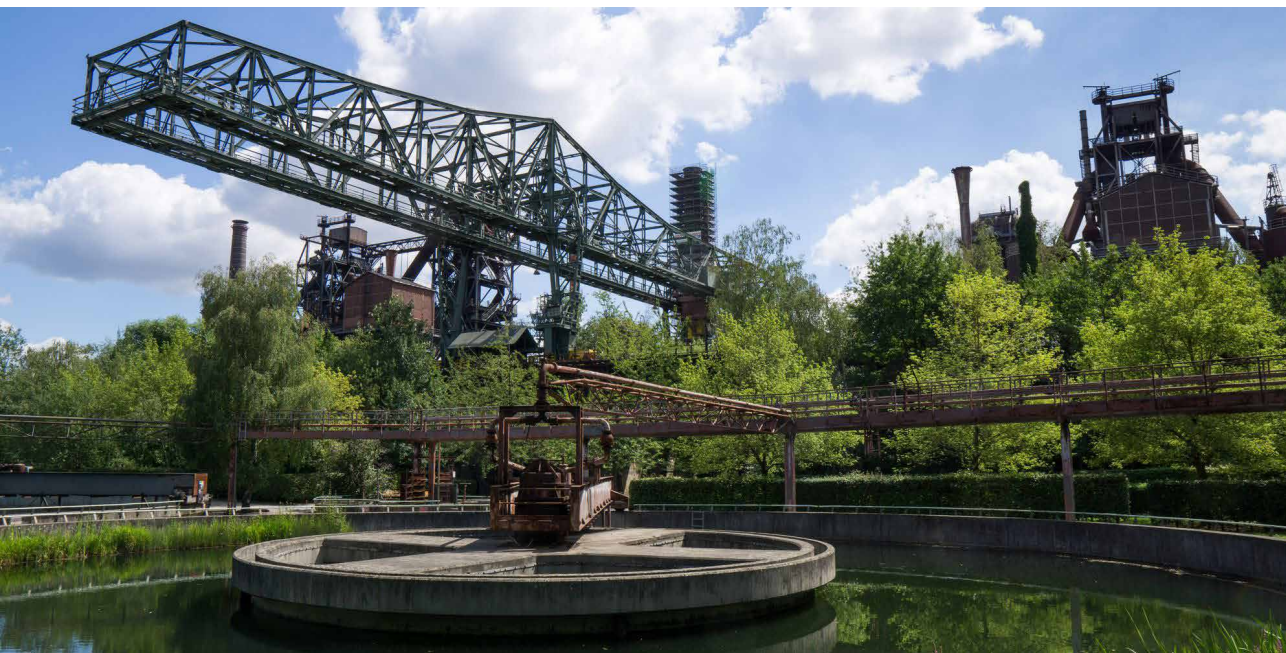
Fig. 9 - Rovine della contemporaneità. Il parco paesaggistico Duisburg-Nord, Germania, 1991 (foto: Latz + Partner).

Matteini, T. 2009, Paesaggi del tempo. Documenti archeologici e rovine artificiali nel disegno di giardini e paesaggi , Alinea Editrice, Firenze.