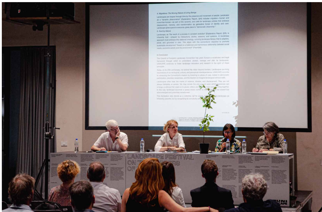
Fig. 2 – Declaration on Borderless Landscapes: presentazione del documento al pubblico, EPIC Center, Nova Gorica.