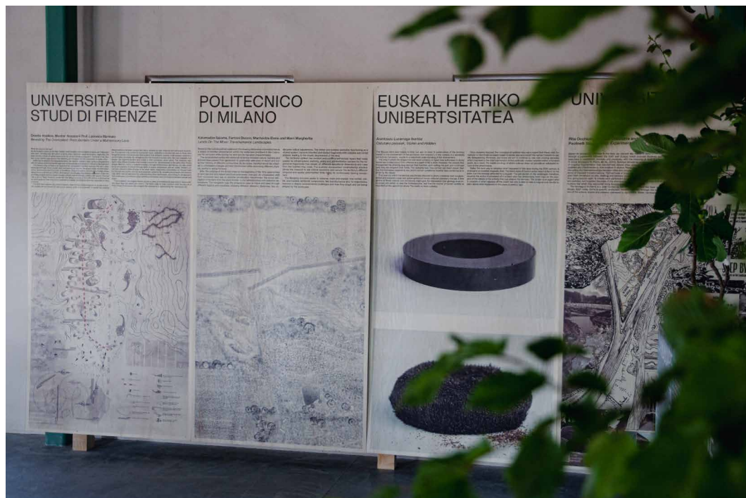
Fig. 3 – Mostra realizzata a partire da una selezione dei poster candidati alla call for visual contributions , EPIC Center, Nova Gorica.

zando il coinvolgimento delle generazioni più giovani, spesso considerate ma difficilmente integrate all'interno delle procedure ufficiali.