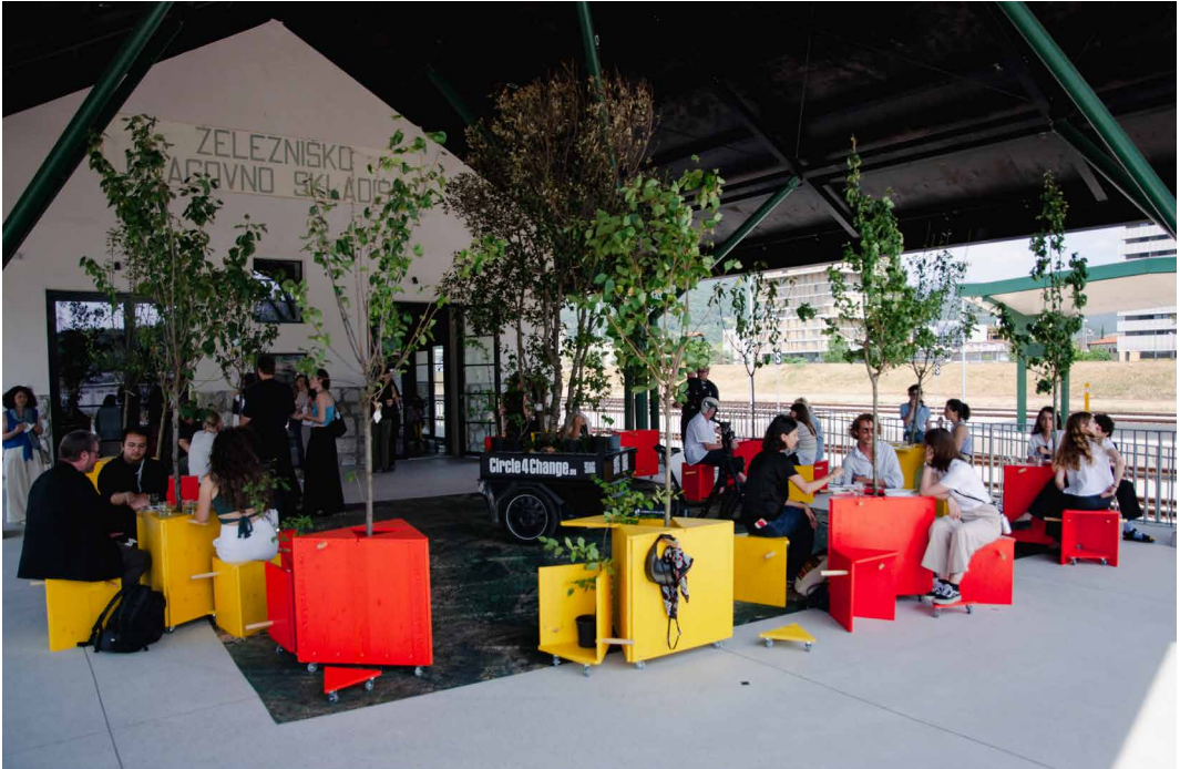
Fig. 1 - Allestimento temporaneo degli spazi esterni, EPIC Center, Nova Gorica.

tempo hanno presieduto UNISCAPE, i docenti, i ricercatori e gli esperti di varia natura – avendo allenato nel tempo la propria capacità di osservazione critica, accrescono il dialogo offrendo una dimensione per lo più interpretativa e riflessiva.