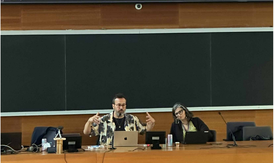
Fig. 5 - "Ungrounding". Nello scatto alle spalle dei relatori l'immagine mostra il processo di trasfigurazione territoriale in atto con le operazioni militari israeliane. Una trasfigurazione profonda e sistematica del territorio in cui si vedono i resti degli edifici sollevarsi in "onde architettoniche", ciò che Weizman chiama una «tempesta di terra» in cui sono annegate migliaia di persone.