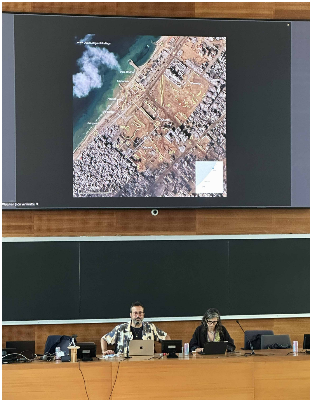
Fig. 4 - Nell'immagine alle spalle di Weizman si vede l'antica Gaza, il sito archeologico noto come Anthon, trasformato in un quartiere generale divisionale e sepolto sotto cumuli di terra. Cimiteri e strati archeologici sono stati deliberatamente cancellati. F.A ha ricostruito con cura quel sito perché non esiste più, se non nelle macerie che lo ricoprono. «Forse futuri archeologi scaveranno proprio quelle macerie e ne recupereranno dei frammenti» dice Weizman.