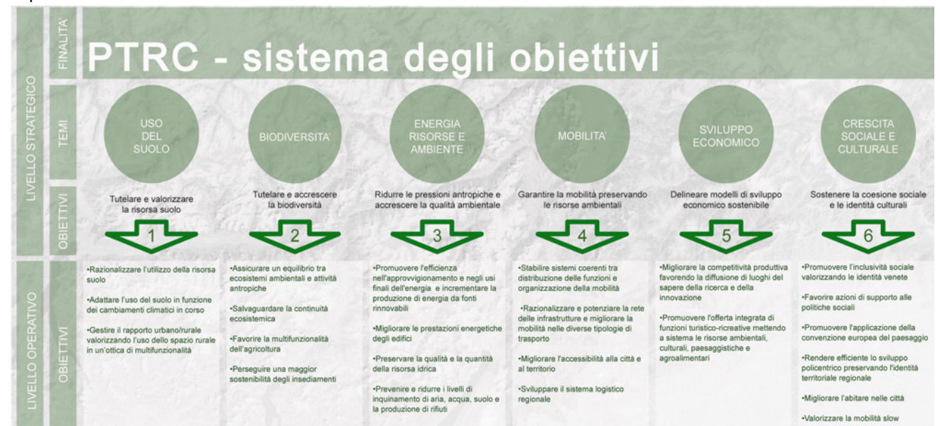
Figura 1. quadro sinottico dei temi, obiettivi, azioni progettuali.

Ma il Veneto è stato interessato anche da interventi di sviluppo non sempre rispettosi delle qualità di quel paesaggio culturale sui quali vanno intraprese azioni di riqualificazione e ripristino.