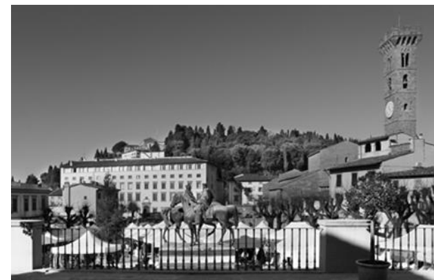
Figura 2. Fiesole, Piazza Mino

1914 Nicola Falcone riteneva che lo Stato dovesse proteggere "i paesaggi anche per non essere accusato di una grave contraddizione: se esso custodisce con religiosa cura, nei musei, i quadri dei grandi maestri del paesaggio, non può lasciare abbandonati i magnifici e irreparabili originali riprodotti sulla tela" (Falcone 1914, p. 25). Al 1922 risale la prima vera legge sul paesaggio 19 , promossa da Benedetto Croce secondo cui "il paesaggio è il volto amato della patria. Più questa visione sarà bella e più si amerà la patria di cui è l'immagine" 20 . Esecutivi della legge Croce si presentavano nella sostanza i principi della Legge sulla tutela delle bellezze naturali voluta nel 1939 dal Ministro Bottai: le "cose immobili che hanno cospicui caratteri di bellezza", ville, giardini e parchi che "si distinguono per la loro non comune bellezza", "complessi di cose immobili che compongono un caratteristico aspetto avente valore estetico e tradizionale", le "bellezze panoramiche considerate come quadri naturali".