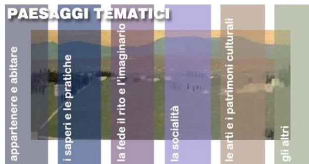
Figura 6. I Paesaggi Tematici

Abbiamo identificato diversi paesaggi tematici: i paesaggi dell'appartenere e dell'abitare; i paesaggi dei saperi e delle pratiche; i paesaggi della fede, del rito e dell'immaginario; i paesaggi della socialità, del commercio e della politica; i paesaggi delle arti e dei patrimoni culturali; i paesaggi degli altri. La combinazione di più voci (paesaggi narrativi) all'interno di uno stesso paesaggio tematico, dovrebbe favorire il senso di polifonie in movimento, costruendo scenografie che seguono i movimenti delle identità che si raccontano, mentre vorremo creare la possibilità di seguire associazioni (inedite) tra diverse fonti conoscitive che il racconto lega e collega attraverso percorsi di interpretazione e di vissuto, come accade durante un'intervista 51 .