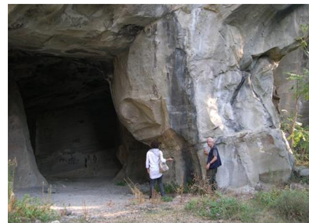
Figura 4. Monteceneri (Fiesole), Valentina Zingari ed Enrico Papini, scalpellino.