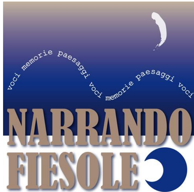
Figura 1. Logo del progetto Narrando@Fiesole

Noi ma anche loro, insomma tutti, 'solo' in apertura di terzo millennio: secondo Convenzione Europea che "definisce il Paesaggio quale determinata parte del territorio, così come è percepita dalle popolazioni" 6 e intende "valutare i paesaggi individuati, tenendo conto dei valori specifici che sono loro attribuiti dai soggetti e dalle popolazioni interessate" 7 che decidono partecipando. Paesaggio e popolo sovrano si sono davvero incontrati molto tardi 8 . Certo non figuravano assieme nella Dichiarazione dei Diritti dell'Uomo e del Cittadino dell' '89 e sarebbe troppo dietrologico, per quanto interessante e prospettico, intravederli presenti e operativi nel diritto alla Felicità previsto due anni prima dalla Costituzione statunitense.