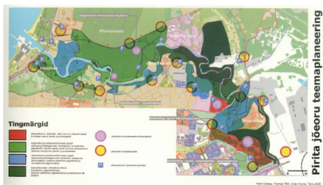
Figura 8. Piano del Parco della Valle del fiume Pirita.

La riforma fondiaria in atto in Estonia si sta dimostrando per certi versi una minaccia per la conservazione dell'area protetta, in quanto i terreni restituiti ai precedenti proprietari potrebbero essere sottoposti ad una pressante speculazione edilizia. Il progetto RiverLinks, come spiega Enno Tamm Mayor, Sindaco del Distretto di Pirita, durante il Convegno, ha dato l'opportunità a Pirita di impostare uno strumento di pianificazione per la tutela e conservazione dell'area, che non trascurasse le esigenze di sviluppo economico e sociale dell'area stessa. Molti degli aspetti sviluppati nel Piano sono emersi durante il workshop, tenutosi a Pirita nel maggio del 2005, dove ai partners è stato chiesto di fornire idee e suggerimenti per porre le basi del piano.