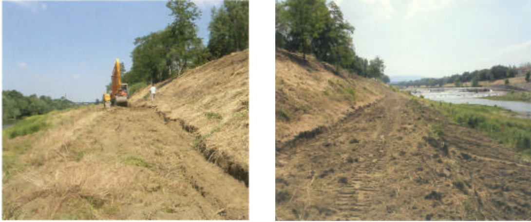
Figura 6. Realizzazione degli interventi nell'area delle Cascine.

Il progetto pilota, redatto dall'architetto Gabriele Paolinelli 9 , ha avuto come obiettivo quello di restituire, ai fruitori del Parco delle Cascine, le sponde del fiume, attraverso un progetto di ridefinizione dell'argine e l'inerbimento dello stesso con un particolare miscuglio di sementi, che permettessero di avere una superficie a prato, di migliore qualità, dove potersi sedere e sdraiare, camminare e rilassarsi.