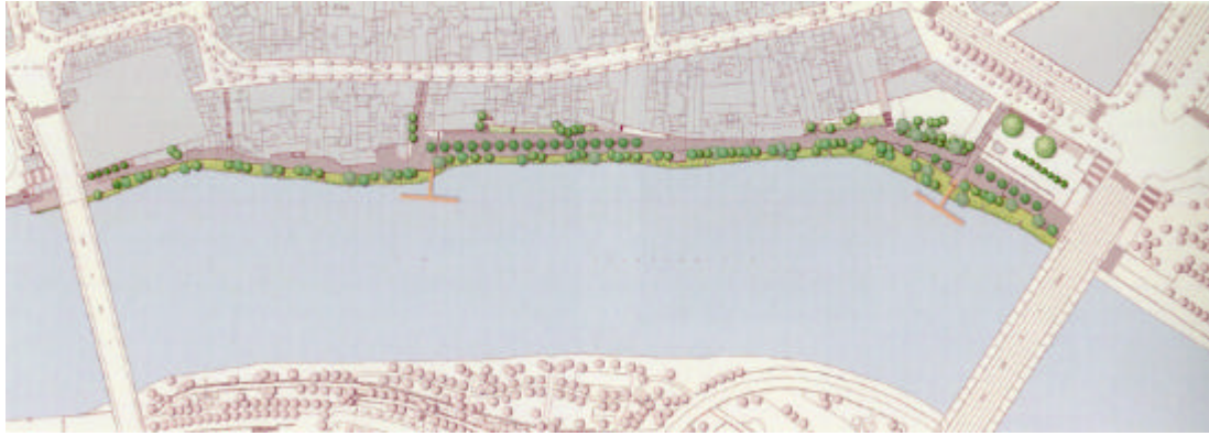
Figura 3. Il Planimetria di progetto del Paseo de la O a Siviglia.