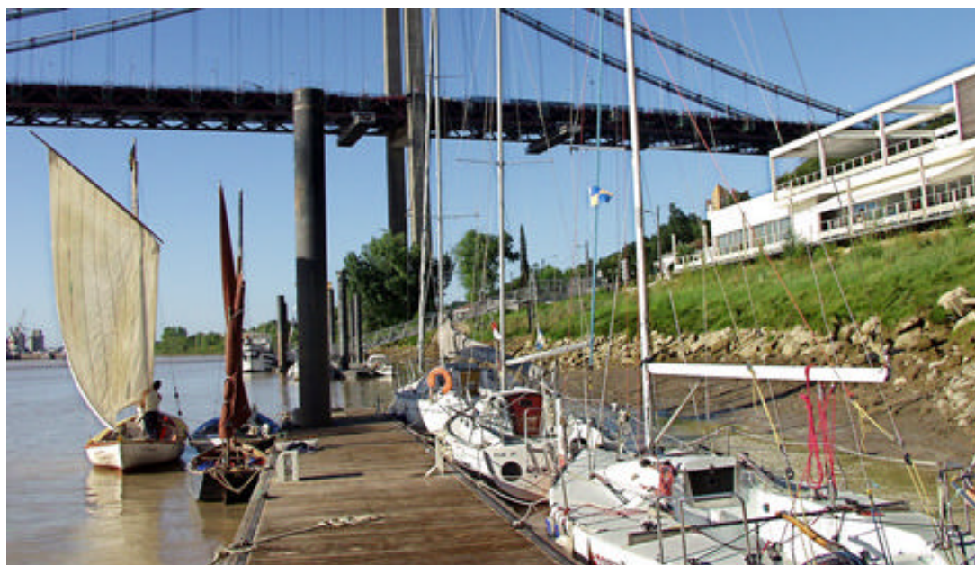
Figura 9. Bordeaux, Lormot il belvedere Les Iris.

ciclabili, aree di sosta e quant'altro necessario al miglioramento della fruizione dell'area fluviale. Come è accaduto a Brema, anche a Bordeaux il progetto è stato condotto attraverso la partecipazione dei cittadini, mediante incontri, assemblee, svoltesi nei tre anni di durata del progetto europeo. A Bordeaux il rapporto stretto tra città e fiume, o meglio tra i cittadini e il fiume è evidente anche per la festa che ogni anno si svolge nel mese di giugno, detta appunto la Festa del Fiume. Nei giorni dei festeggiamenti il Fiume è il vero protagonista, tutte le manifestazioni e gli spettacoli si svolgono lungo le sue sponde e nelle aree prossime al fiume.