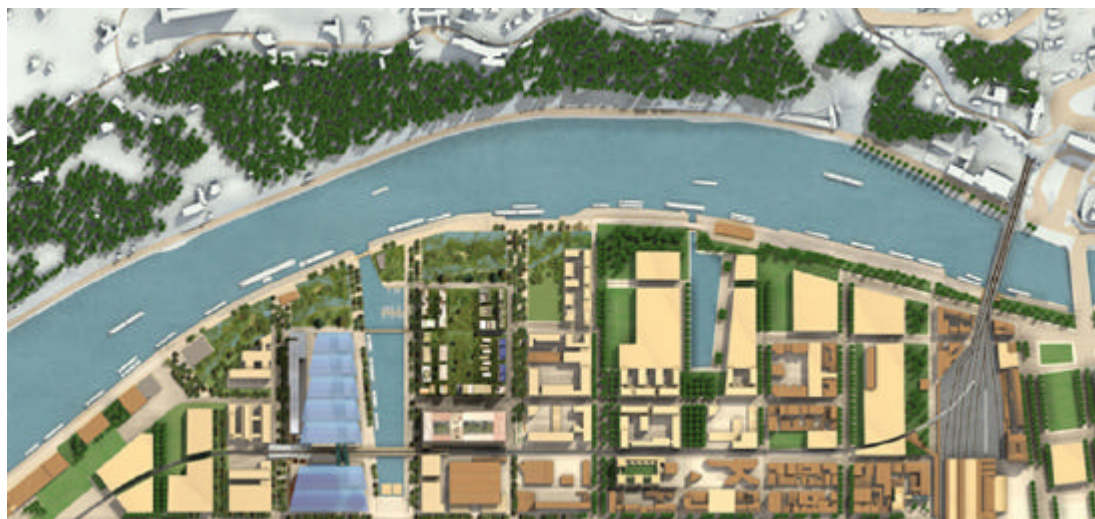
Figura 10. Progetto del Parco della Saône.

L'importanza del ruolo del fiume e dell'acqua nella città, e del rapporto che con esso viene instaurato, è ben rappresentato dal progetto del Parco della Saône, presentato al convegno dall'architetto paesaggista Georges Descombes 15 . Il parco si estende lungo le sponde della Saône, penetrando nel tessuto urbano, tra i palazzi e nelle strade. Il nodo centrale del Parco si sviluppa attorno alla Place Nautique . Il grande piano d'acqua riprende la tradizione delle grandi piazze lionesi, ma l'elemento centrale è l'acqua a rimarcare il rapporto che tra città e fiume si stabilisce.