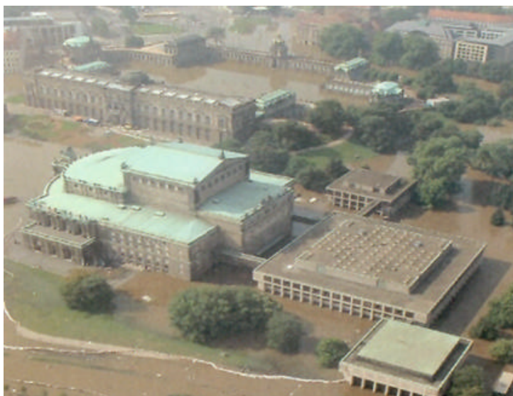
Figura 4. Il Teatro dell'Opera di Dresda nell'alluvione del 17 agosto 2002.

Il progetto si inserisce all'interno del Piano per le Inondazioni, e consiste principalmente nella realizzazione di muri di protezione, che creano una sorta di muro di fortificazione, che riprende il concetto delle mura storiche della città, e che termina con un parapetto lungo la passeggiata pedonale, all'interno di questo parapetto si trova un elemento mobile, che in caso di alluvione fuoriesce dal muro, aumentando la superfici verticale di protezione. Il progetto sarà concluso interamente nel 2008.