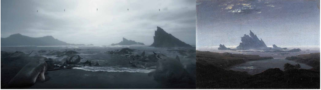
Fig. 3 – Immagine di gameplay da Death Stranding (2019) accostata a Felsenriff am Meeresstrand , Caspar David Friedrich (ca. 1824), Staatliche Kunsthalle, Karlsruhe.

camente piuttosto inefficaci su un terreno perennemente accidentato, in cui le strade asfaltate costituiscono rare eccezioni. In qualunque momento il giocatore ha però facoltà di fermarsi a contemplare il paesaggio e, sfruttando una sofisticata macchina fotografica virtuale, immortalare ed eventualmente condividere i luoghi che più lo hanno colpito e affascinato. Inoltre, a missione conclusa e in contrasto con le atmosfere malinconiche della trama, è possibile scattarsi persino un selfie spensierato a ricordo dell'impresa appena compiuta.