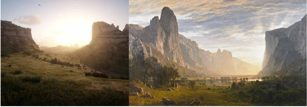
Fig. 1 – Immagine di gameplay da Red Dead Redemption 2 (2018) accostata al dipinto Looking Down Yosemite Valley, California (1865), Albert Bierstadt, Birmingham Museum of Art.

sentata con un accurato mix di conifere e latifoglie, senza trascurare il sottobosco caratterizzato da felci e arbusti, le piante erbacee lungo i sentieri e nelle radure (Dwiar, 2017). Vi è una vera e propria ecologia che regola il mondo virtuale e quindi, gli dà forma e significato (Carter, 2007). Al di là dell'esattezza maniacale nella ricostruzione della natura, tuttavia, l'influenza dei paesaggisti della Hudson River School in Red Dead Redemption 2 si rintraccia nel senso di immensità degli spazi tipico della wilderness all'epoca dei pionieri. La Scuola dell'Hudson è stata eccezionalmente efficace nel rappresentare i grandi spazi della frontiera. Se molti di questi dipinti si distinguono per le grandi dimensioni delle tele 3 , pensate proprio per trasmettere all'osservatore un senso di grandezza e maestosità, con tecniche diverse – non misurabili in metri ma in gigabyte di dati – gli sviluppatori del gioco hanno cercato di ottenere lo stesso effetto.