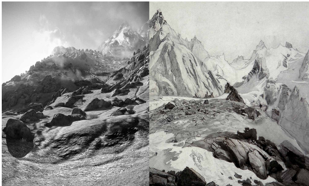
Fig. 4 – Gnashers , Justin Berry (2013) accostata a Aiguille Blaitiere von Norden , John Ruskin (ca. 1856) (elaborazione grafica dell'autrice).

Forse è proprio per questo che l'arte contemporanea nutre interesse per i microspazi normalmente non visti che fanno da sfondo ai giochi di azione, al fine di rubarne i frame più insospettabili. Ad esempio, l'artista Justin Berry ha utilizzato composizioni di schermate da videogiochi incentrati sulla guerra per catturare un momento, un singolo albero, o una roccia (Meier, 2013), con uno sguardo che si ispira alle fotografie di Ansel Adams o agli studi sulle rocce di John Ruskin. Mark Tribe, un altro artista americano contemporaneo, si è ispirato in modo simile a questi paesaggi virtuali per la serie Rare Earth 9 , dove si concentra sui 'momenti di trascurata bellezza' in questi luoghi di violenza virtuale (Romero, 2012). La dialettica in atto tra videogioco e arte contemporanea è più che mai fertile e feconda. L'operazione critica da parte degli artisti è tesa a svelare la profonda intenzionalità progettuale che si cela dietro una scena che superficialmente potrebbe apparire un semplice sfondo, il paradosso di una 'natura'