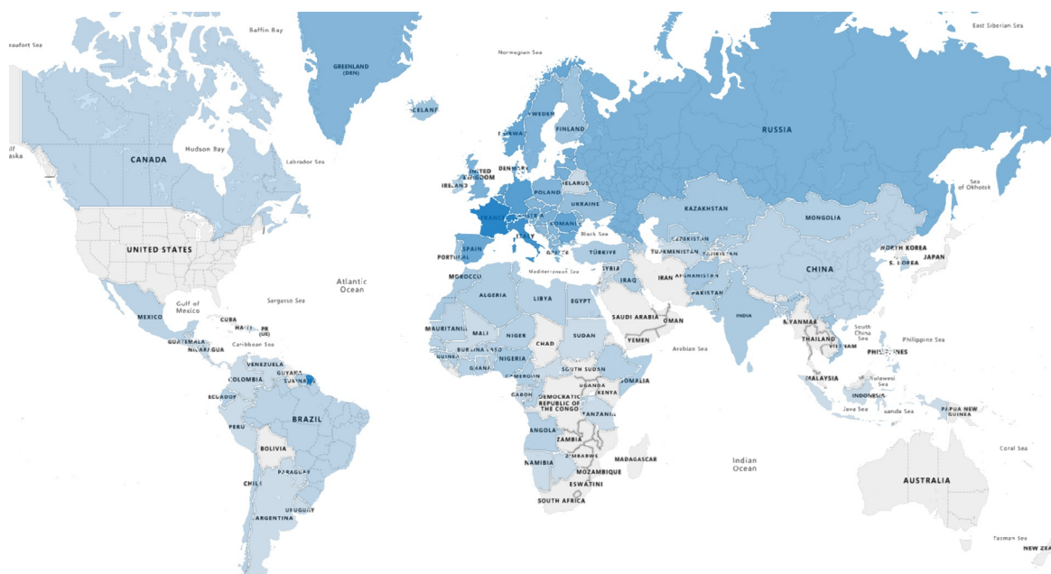
Carte 1. L'expansion du système européen de réadmission (décembre 2025)

Légende : plus la couleur est foncée, plus le pays est engagé dans le système européen de réadmission.