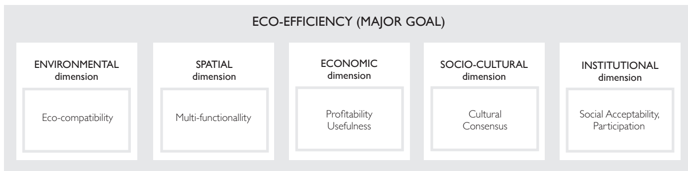
TAB. 1 | Le cinque classi esigenti dell'eco-efficienza The user requirement classes of eco-efficiency

il rapporto tra SE e paesaggi. A questi si aggiunge una quinta dimensione, di tipo spaziale-funzionale, che evidenzia l'effetto fisico del SE sul paesaggio atto ad indurre una trasformazione sia nelle sue componenti oggettive che soggettive, pregiudicando potenzialmente nel tempo l'equità intergenerazionale, come suggerisce la possibile coincidenza fra principi della sostenibilità e della conservazione (Rodwell, 2009).