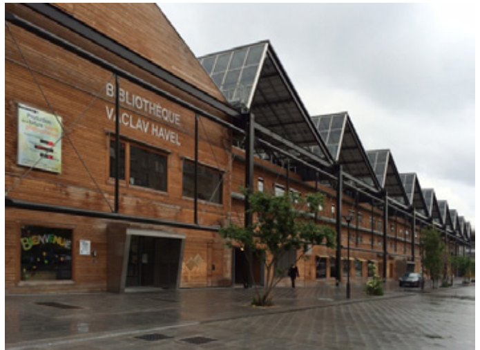
01 | Parigi 18e, Ville de Paris/DPA/DEVE/SEMAEST/Federation Unie des Auberges de Jeunesse, Jourda Architectes Paris, 2008-13 – Caso studio paradigmatico: Riabilitazione di Halle Pajol.

Paris 18e, Ville de Paris/DPA/DEVE/SEMAEST/Federation Unie des Auberges de Jeunesse, Jourda Architectes Paris, 2008-13 – Selected case study: Rehabilitation of Halle Pajol.